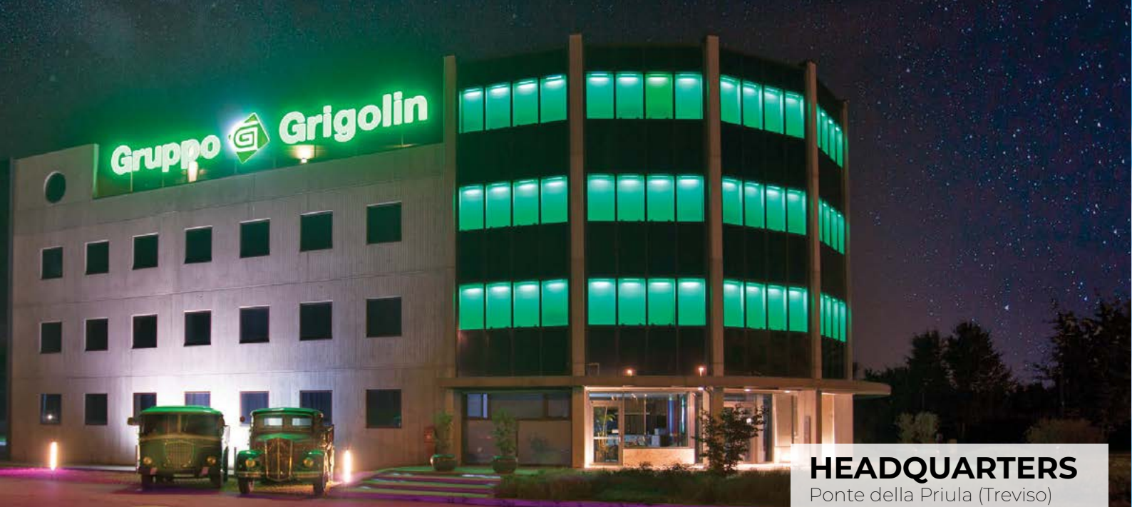
HEADQUARTERS Ponte della Priula (Treviso)